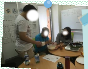
イチゴやクリーム、チョコ ソースなどをトッピング！ おいしそうに 出来ました☆