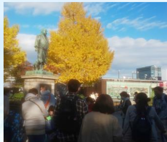
見事なイチョウの木でした♪

紅葉狩りに上野公園を散策しました！ 真っ青な秋空の下、みんなで澄んだ空気を思いきり吸ってリフレッシュできました♪