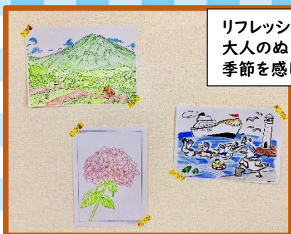
リフレッシュタイムでの大人のぬりえの作品。季節を感じますね。