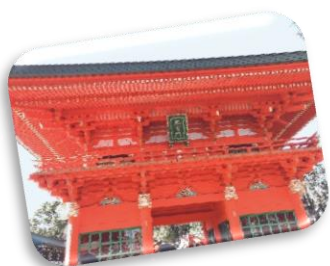
おみくじも引きました♪

神社では、一年間仕事に過ごすことができた感謝と今年一年、健康に幸せに過ごせるようお願いしました。メンバーさんが昨年よりも充実した一年になるようスタッフ一同、一丸となって支援をしていきたいと思えます。