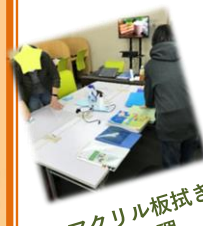
アクリル板拭き 教本整理

毎年年末はご利用者の皆さんと大掃除を行っています。協力して丁寧に作業をしてくださり、いつも気持ちよく新年を迎えることができています。